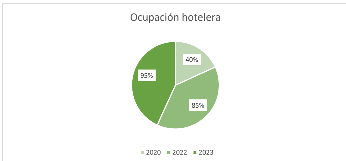
Figura 1. Ocupación hotelera en función del periodo (2020-2023)